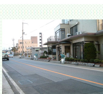
県道沿いを清掃中

環境問題への身近な取り組みとして始めたことですが、このような事を社員全員で取り組めることに、地元企業としての感謝と誇りを感じます。これからも末永く続けていきたいと思っております。