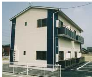
ワンルームマンション外観

ワンルームマンションはロフト付という事で、新築やリフォームをお考えの方にも十分ご参考にして頂けたかと思えます。また、見学会場では枠にはまった形から抜け出せずにお悩みの方も、弊社のフリープラン、フリーオーダーの注文住宅の良さを確認していただくことが出来たことは、大変有意義でした。さらに、今まで建築をさせて頂いたお客様やこれから建築をさせて頂くお客様にもご来場頂き社員一同喜んでおります。この度は快く見学会を開催していただきまして、本当にありがとうございました。