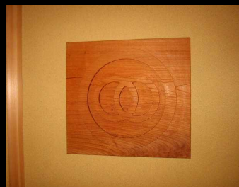
手作りの脇坂家家紋

元企業さんとしてアフターもきちんと対応して頂けるので安心です。」とお褒めの言葉をいただきました。始とありませんが、地味なところには、住み心地も良く室内はとても静かで快適です。去年は台風が多い年でしたが家に居ると台風でも全く気にならず心強かったです。気になるところは、