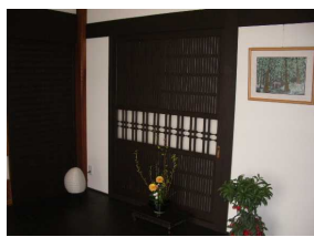
お気に入りの連子格子

内観・外観は黒と白を基調としたシンプルなお家を希望されていました。外壁は黒紅柄とシックい黒と白のコントラストにより重厚感のある