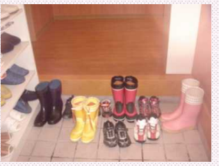
マナーが身につく様子