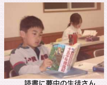
読書に夢中の生徒さん

最後に、夜遅くの送り迎え等でご迷惑をお掛けしているご父兄や地元の皆様にはとても感謝していますとおっしゃっていました。