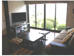
鏡代わりにもなる大きな窓

奥様がもうひとつ喜ばれているのがサニタリー。仕事に行っておられるので、洗濯物の心配をしなくていいのでとても助かっているそうです。照明・カーテンはセイコーヴィーバスさんによる和の要素を取り入れたコーディネートです。