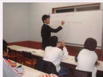
中学生の授業風景

今回の繁盛店さんは、長浜市勝町にある「総合学習塾集い」さんです。平成15年に1号館を、昨年2号館を当社で設計施工させて頂きました。年々生徒数が増え続けている集いさんの魅力をご紹介します。