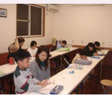
小学生の授業風景

先生と生徒、そして保護者との良好な信頼関係を大切にされた環境づくりを考えておられます。