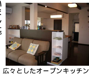
広々としたオープンキッチン

ご夫婦がセイコーヴィーバスさんに行かれ、気に入られてお任せにされました。リビングの大きな窓にシェードを提案して頂いたのが、外がよく見え、また窓のサイドに生地が溜まらず、すっきりとしているので夜は奥様の趣味でもあるフラダンスの鏡代わりとしても大活躍です。