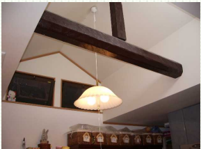
キッチンの吹き抜け

また、2階は勾配天井を上手くつかう事で広々ロフトをつくり、キッチン部分を見せ梁の吹き抜けにするなどこだわっておられ、特にキッチンの吹き抜けはご主人のお気に入りだそうです。(実は、ロフトやキッチンの梁はご主人自ら、朝の4時までかかって塗られました。)