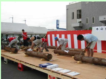
去年の丸太切りの様子

今回は、初の試みとして大道芸のプロを二人お招き致します。木工教室やタイルアートなどの体験コーナーは昨年同様に、またおなじみのピンゴゲームや飲食コーナーもパワーアップして開催させて頂きます。