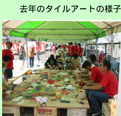
去年のタイルアートの様子

さて、倶楽部通信第6号でもご紹介した通り、昨年はお祭りの収益金で「AED」を長浜西中学校さんに寄贈させて頂きました。今年もまつりの収益金を何らかの形で社会のお役に立てて頂こうと考えております。