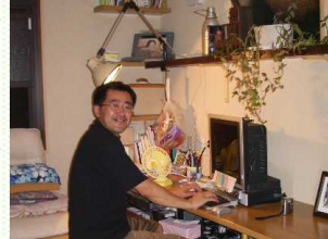
ご主人自慢の 書斎にて...