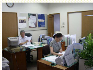
お工作中的の先生

公証人役場さんでの主な業務は、会社の定款の認証、金銭の契約書、任意後見制度、遺言(公正証書遺言)、協議離婚の場合の公正証書の作成、立会い事実実験などです。