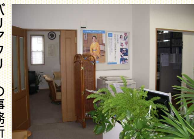
バリアフリーの事務所