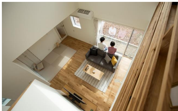
※写真は現在公開中の田村モデルハウスです